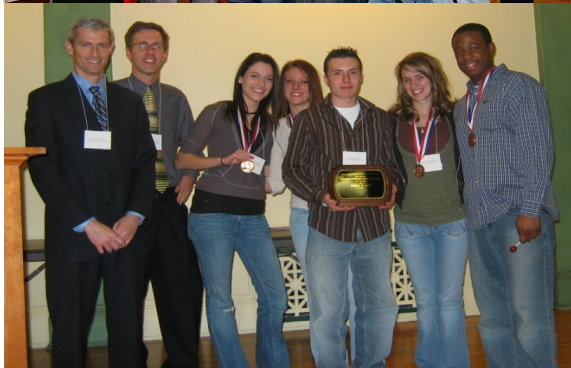
איור 1: שני צוותים זוכים בתחרות תכן הנדסי